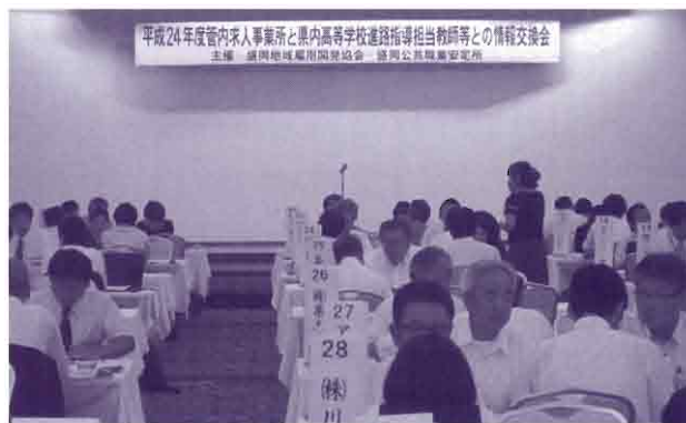
昨年の情報交換会の様子

※ 詳細につきましては、 当所 求人・企画部門学卒担当 (019-624-8905) まで お問合せください。