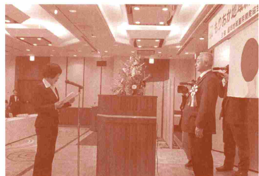
写真は、平成24年度「合同歓迎会」の様子