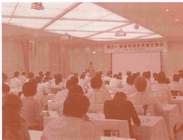
第一部 雇用関係情報交換会

第二部の障がい者就職相談会では、昨年を上回る33事業所の参加がありました。障害者を取り巻く就職状況は依然として厳しい状況が続いている中で、たくさんの障がい者の方が、真剣に各ブースでの企業人事担当者の説明を聞き情報の収集を行っていました。（参加事業所33社、参加者202名）