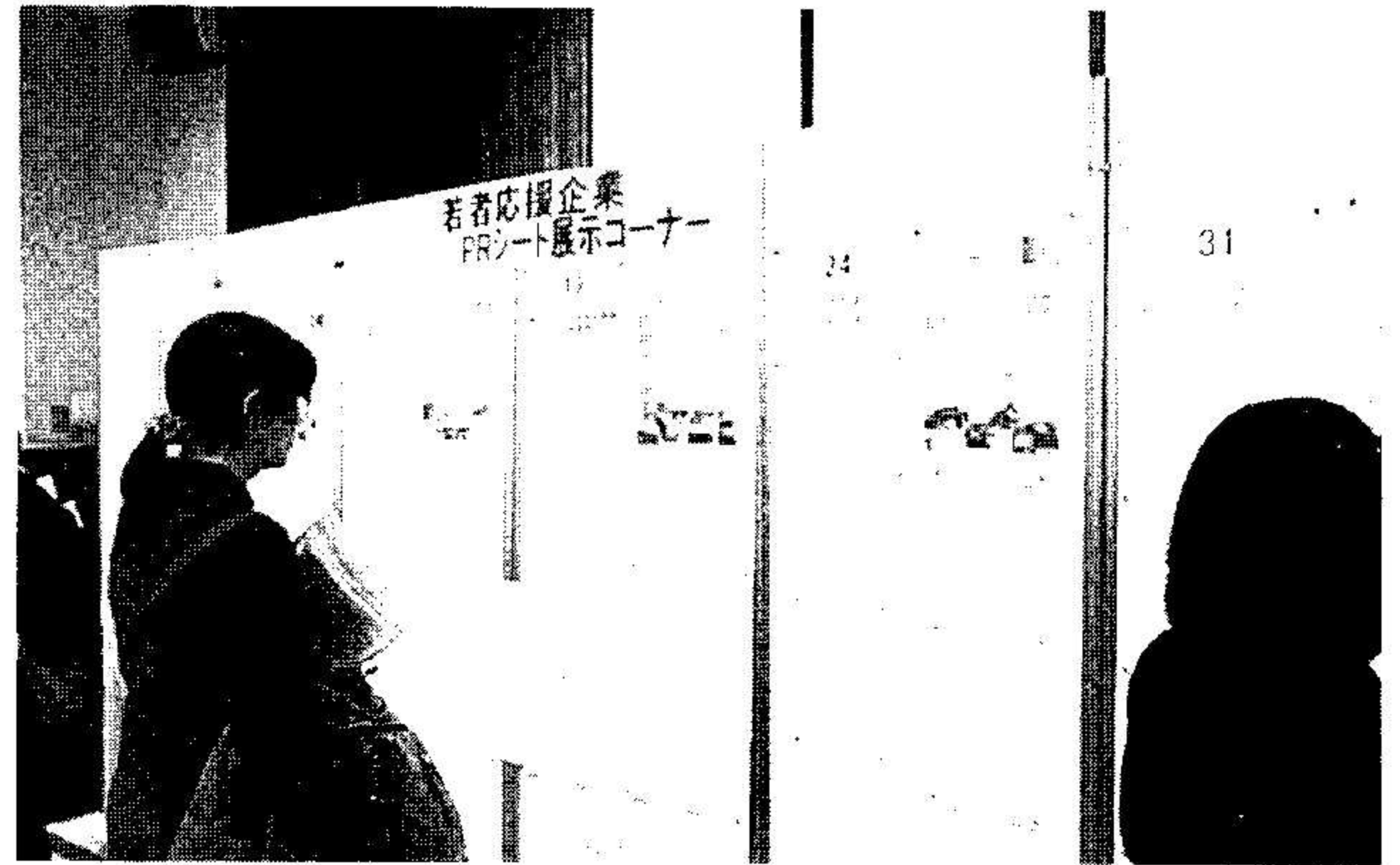
若者応援企業PRコーナー