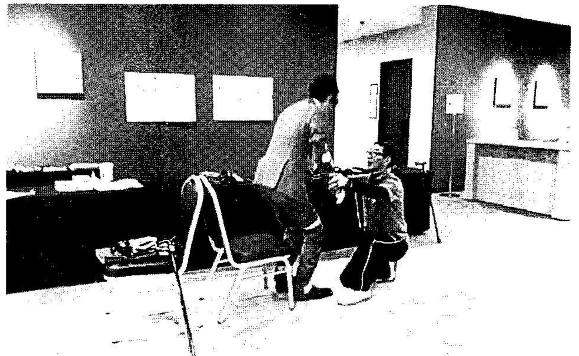
高齢者体験コーナー