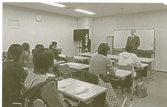
第3回セミナーの様子