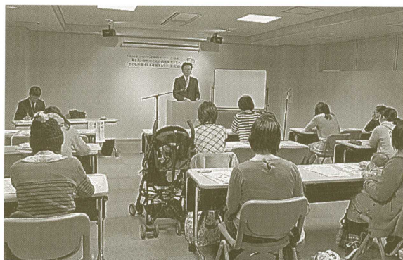
第2回セミナーの様子