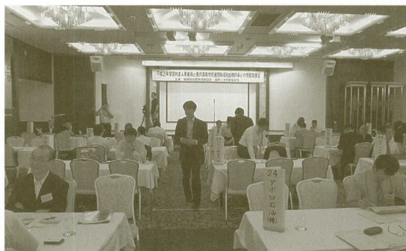
昨年の情報交換会の様子

※ 詳細につきましては、 当所 求人・企画部門学卒担当 (019-624-8905) まで お問合せください。