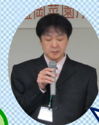
菜園庁舎館長より挨拶

有効求人倍率は1倍を超えているが、非正規求人が約6割。労働者自身がトラブルを未然に防ぐため、是非労働法を学んでほしい。