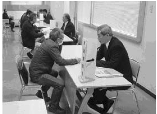
後半：参加者と企業との個別面談のようす