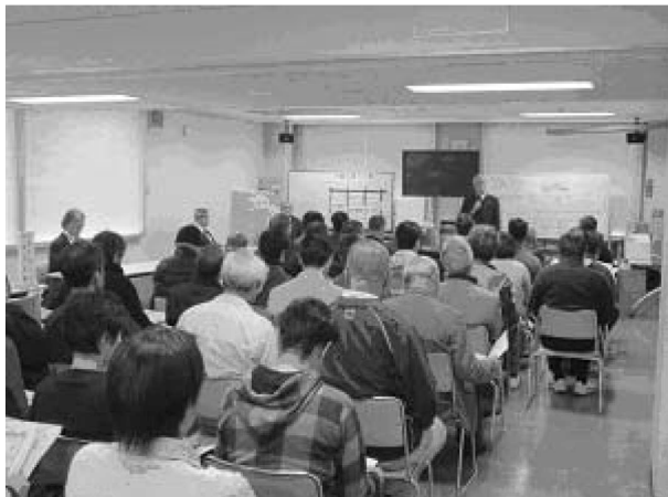
前半：岩手県警備業協会から概況・今後の見通しを説明

人材不足の解消のためには未経験者の就職促進、採用後の人材育成も重要な人材確保のポイントとなります。求職者に向けた情報発信や人材確保に向けてのご相談など、「人材確保対策コーナー」をご利用ください。