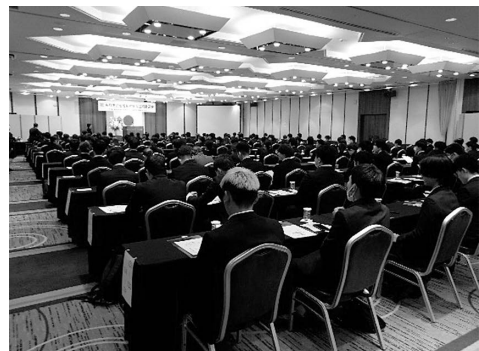
（写真は、前年の「新社会人合同歓迎会」の様子）