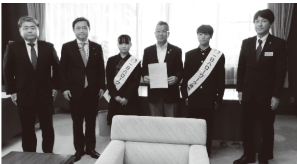
盛岡商工会議所での要請

要請で二人は、「多くの高校生が盛岡地域への就職を希望しています。岩手の未来を担う高校生が地元で活躍できるよう、早期の求人の提出をお願いいたします。」「盛岡地域で就職し、地域の企業、地域の人々のために貢献したい。これが私たちの希望です。一人でも多くの高校生が盛岡地域に就職できるようお力添えください。」と述べ、強い思いを伝えました。