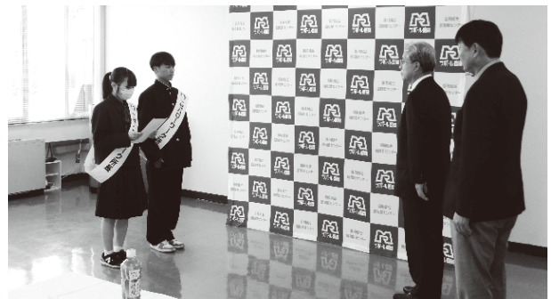
協同組合盛岡卸センターでの要請

令和7年3月新規高等学校卒業予定者を対象とする求人は、6月1日（土）から受付を開始し、7月1日（月）から公開を開始します。