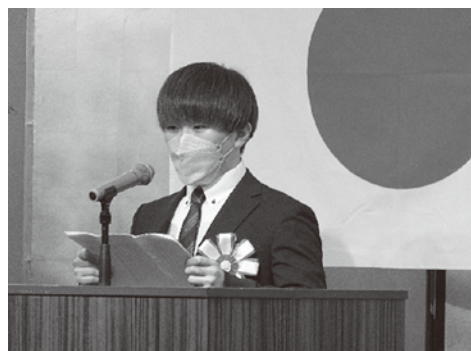
（写真は、前年の「合同歓迎会」の様子）