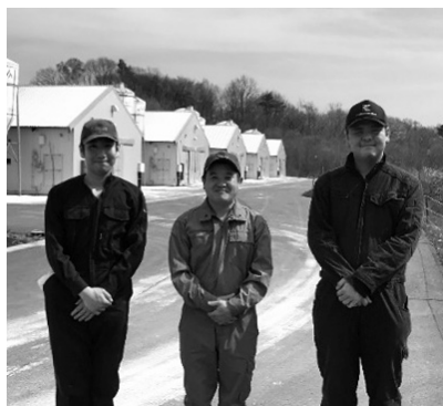
農場で活躍している飼育員