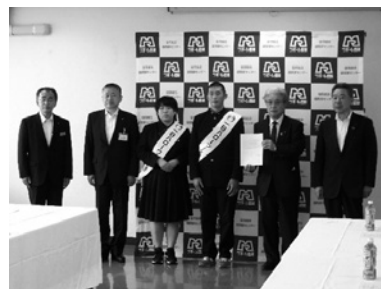
【協同組合盛岡卸センターでの要請】