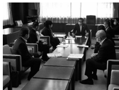
【盛岡商工会議所での要請】