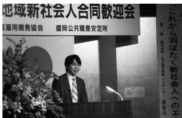
新社会人へのエール (講演)