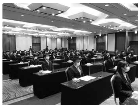
(写真は、前年の「合同歓迎会」の様子)