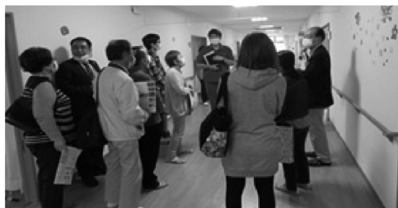
※施設を見学し、詳しく説明が聞けます