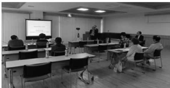
※企業情報や施設の取組み等の説明の様子

職場見学を終えた後の面接会では、参加者と施設担当者との情報交換が行われ、就職が決定する方もおりました。人材確保対策コーナーでは、求職者の皆様の参加意欲、満足度が得られるイベントをこれからも企画していきたいと考えています。