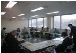
平成28年度「いわて年末年始無災害運動」に係る関係団体代表者連絡会議 日時：平成28年11月15日（火）場所：大船渡労働基準監督署会議室 会議状況