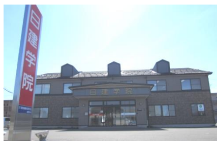
無料駐車場50台完備 コンビニ徒歩3分、イオン車で5分