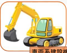
車両系建設機械 (解体)