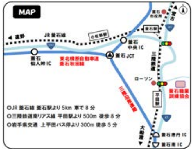
選考・訓練実施場所地図▲

● 実施主体 ● 岩手県立宮古高等技術専門校 岩手県宮古市松山第3地割29番地3 0193-62-5606