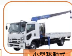
小型移動式 クレーン

その他基本的なビジネスマナー、PC基本操作、履歴書作成・キャリアコンサルティング等就職支援