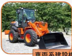
車両系建設機械 (整地)