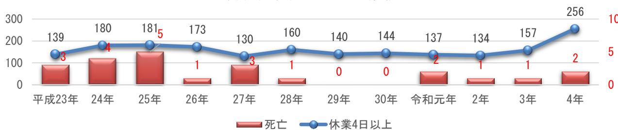
労働災害発生状況の推移

事故の型別では、新型コロナウイルス感染症が含まれる「その他」が突出して高いほか、「転倒」「はさまれ・巻き込まれ」「墜落・転落」「動作の反動・無理な動作」「激突され」「交通事故」などの順で多く発生しています。