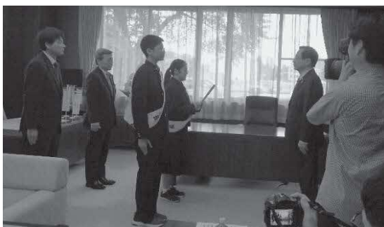
【盛岡商工会議所での要請】

求人要請において二人は、「地元の盛岡地域で就職し、地域の人々の暮らしに貢献していきたい、そして安心して自身が成長できる職場で働きたいという思いは、多くの高校生に共通する切実な願いです。」「一人でも多くの高校生が盛岡地域で就職し、活躍できるよう、求人の早期提出や、人材育成の促進、働きやすい職場環境づくりについて、会員企業の皆様に周知いただきますようお願い申し上げます。」と述べ、強い思いを伝えました。