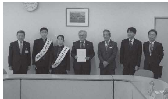
【協同組合盛岡卸センターでの要請】

令和9年3月新規高等学校卒業予定者を対象とする求人は、令和8年6月1日(月)から受付を開始し、7月1日(水)から公開を開始します。