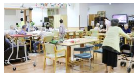
有限会社 プライステージ