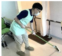
住宅型有料老人ホームこはくの風 内丸 デイサービスセンターこはくの風 内丸