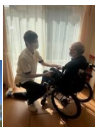
Unity Care株式会社 Unity Well株式会社