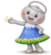
ハローワーク盛岡 マスコットキャラクター 「もりてつぼん」