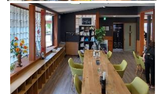
デイサービス cafe 15 TreeStarHOME