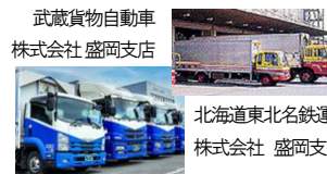
武蔵貨物自動車 株式会社 盛岡支店