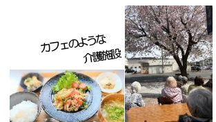
カフェのような 介護施設