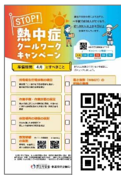
キャンペーン リーフレット

暑さが本格化する前に、日常生活で無理のない範囲で汗をかくようにしましょう（歩く・走る・ストレッチなどの適度な運動、湯船に浸かる）。数日から2週間ほどで順化が完了します。