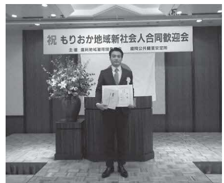
職業生活体験作文表彰者