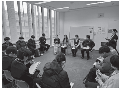
フリータイム (若手社員ブース)