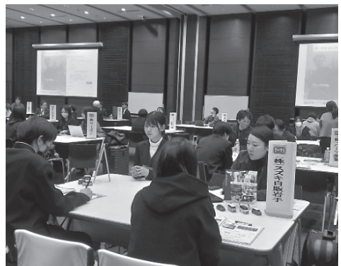
フリータイム (企業ブース)