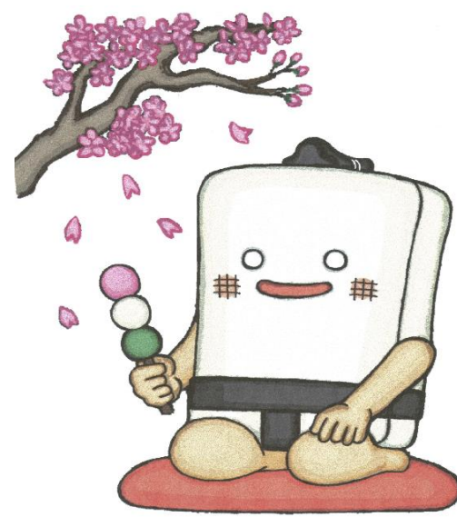
ハローワーカー関 マスコットキャラクター 【もちのせき】