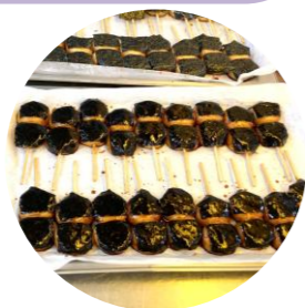
揚げ餅(写真) 大変美味しそうでした！

一関市ふるさと納税の返礼品に指定されている商品も作っている為、全国に発送している。当日は揚げ餅づくりの見学後、団子の串差し作業を見学。1本の竹串に4個の団子を刺していく。1cm弱の厚さの団子の中芯を見事な手捌きで刺していた。見学者は団子刺しの手早さに感心しきりでした。「分からない事があったら遠慮なく聞くことが大事」とのアドバイスも頂きました。