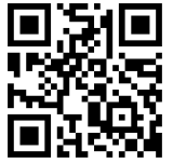
申込み メールフォーム

【必要事項】 1.氏名（フリガナ） 2.電話番号 3.ハローワーク求職番号 4.希望日時（第2希望まで） 5.希望する相談担当者(任意)