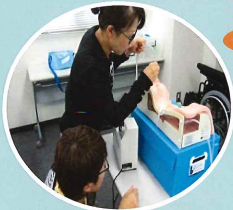
模型や器具を使用しての実技指導 ※写真はイメージです