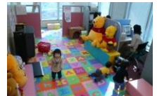
全オフィスに保育士を常駐安心してお仕事探しに専念