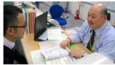
業界に精通した専任がマン・ツー・マンでサポート!