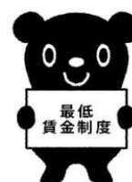
最低賃金制度のマスコット 「チェックマン」

したがって、最低賃金未滿の賃金しか支払わなかった場合には、最低賃金額との差額を支払わなくてはなりません。また、地域別最低賃金額以上の賃金額を支払わない場合には、最低賃金法に罰則（50万円以下の罰金）が定められ、特定（産業別）最低賃金額以上の賃金額を支払わない場合には、労働基準法に罰則（30万円以下の罰金）が定められています。