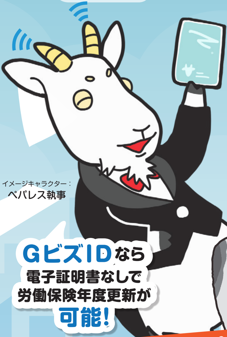
イメージキャラクター： ペパレス執事