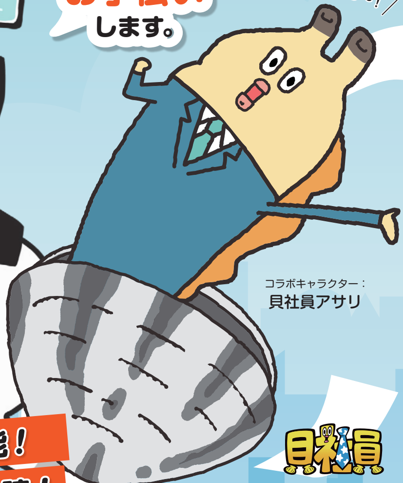
コラボキャラクター： 貝社員アッサリ