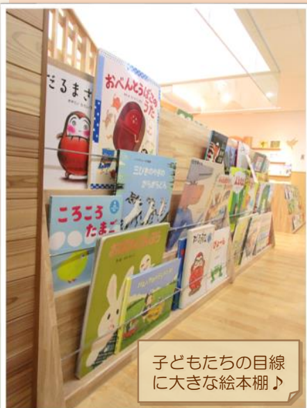
子どもたちの目線 に大きな絵本棚♪

読書教育に力を入れており、 絵本3,000冊以上 がそろって、絵本館のようです♪