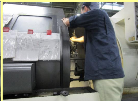
機械のセッティング2

製品の品種にあわせてプログラムの設定変更や刃物工具の交換、寸法補正、検査までの一連の作業です。スムーズに進めて生産活動のロス率を下げます。