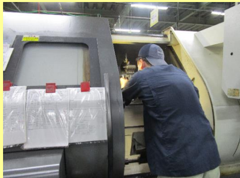
機械のセッティング1