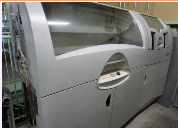
3Dプリンターでモデル作成