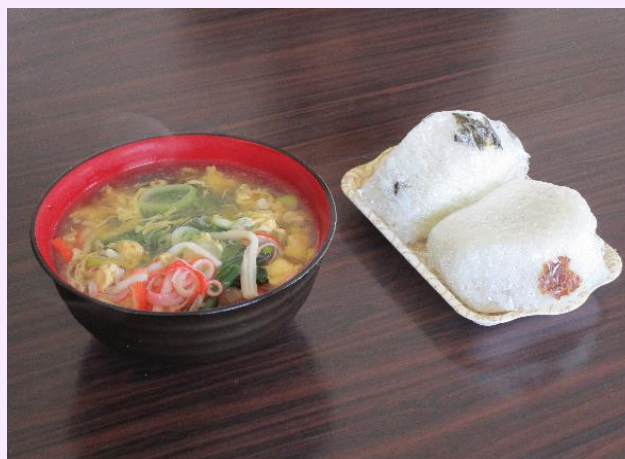
野菜たっぷりの汁物とおにぎり