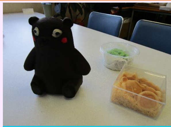
作った金型で焼いたお菓子（一例）