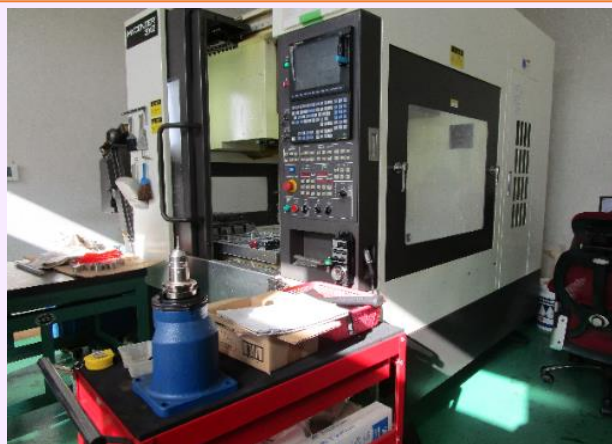
マシニングを用いて削り出し