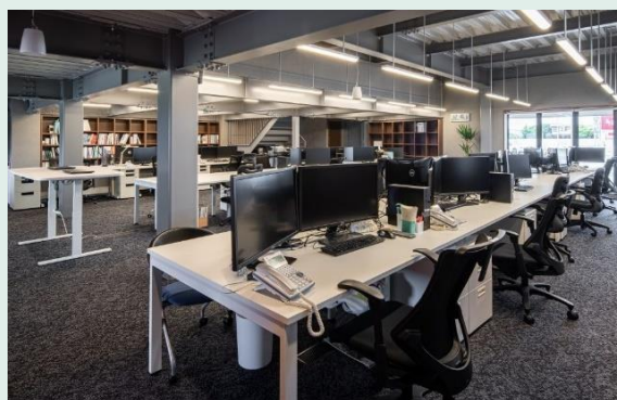
【設計室（執務スペース）】