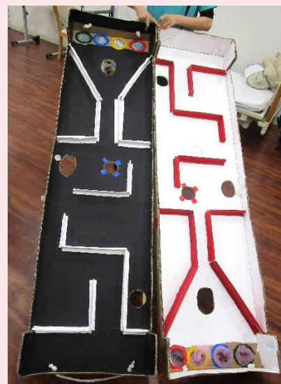
レクリエーションの小道具 送迎の後につくったり、 利用者さんと一緒につくることも。

ただし、本人のキャリアアップや適性・希望に応じて部署異動の可能性もあります。異動の際は、事前に本人との面談のうえ、納得していただいて決定します。