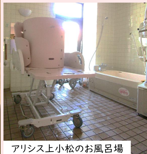
アリス上小松のお風呂場