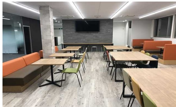
■カフェのような事務所2Fの食堂