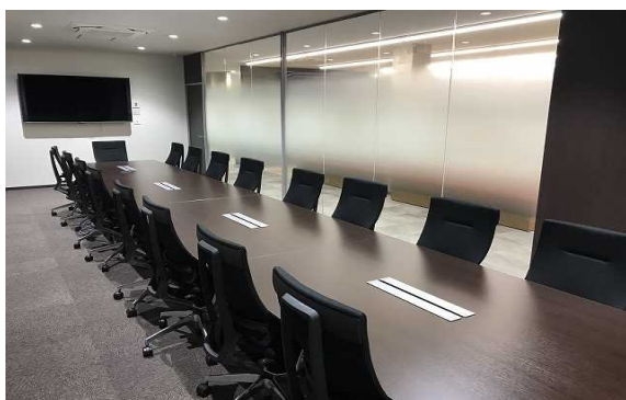
■食堂横には、会議室があります