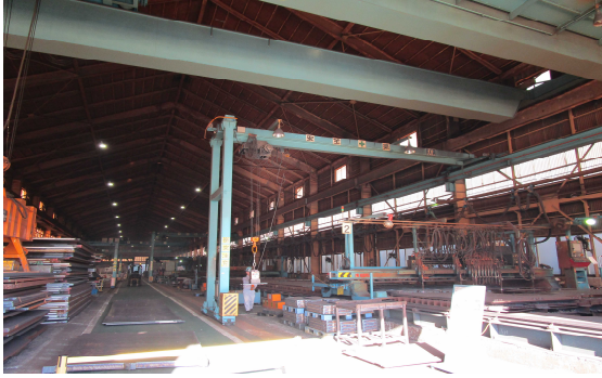
■第一工場入り口より