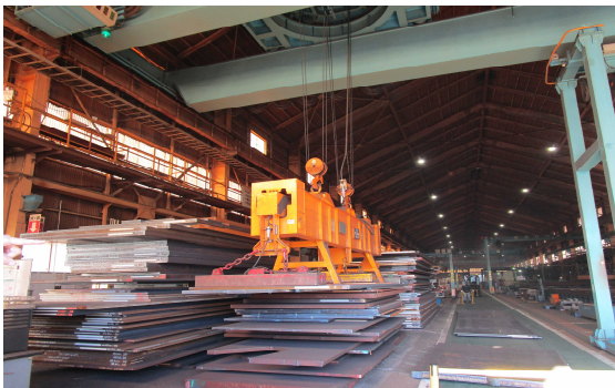
■リフティングマグネット