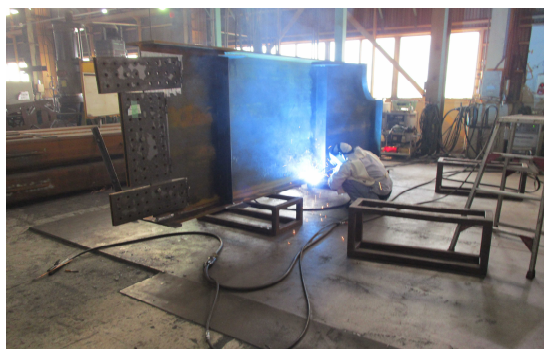
■第二工場で溶接作業をしています