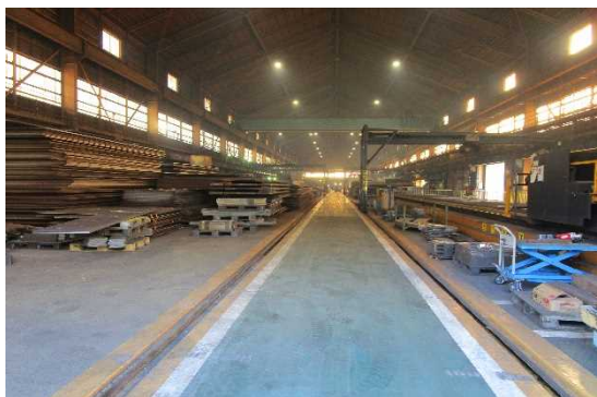
■第一工場反対側より