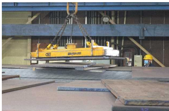
■リフティングマグネットで釣り上げて 鋼材の配替え作業をしています