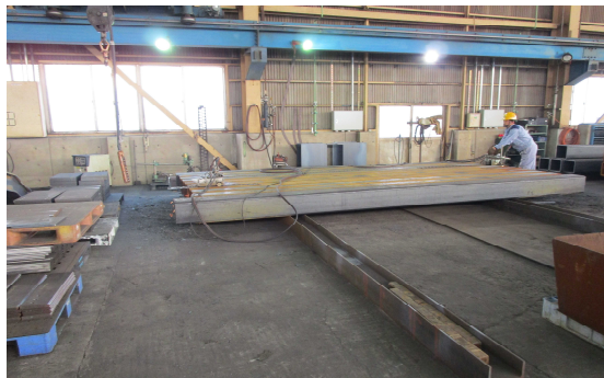
■建築用鋼材を加工しています