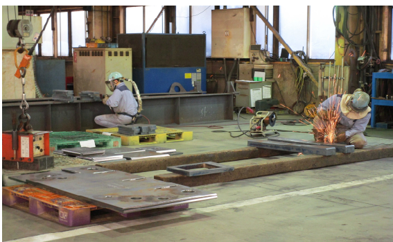
■切断した鋼材をグラインダーでバリ取りします