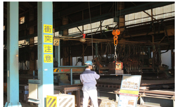
■リフティングマグネットを操作しています