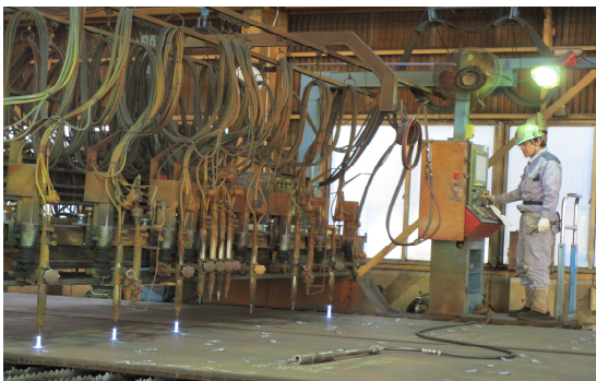
■NC ガス切断機の噴射口の調整をしています