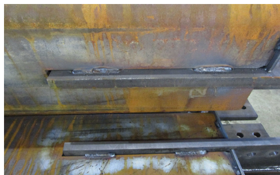
■仮溶接した建築用鋼材