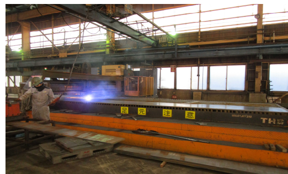
■プラズマ切断機で鋼材を切っています