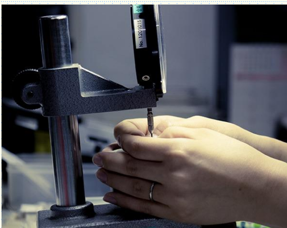
▲ 機械から出てくる製品の規格が正しいかを計測器を使用して計測します。

製品にずれがある時や、違う製品に取り替える時に機械を調整します。勘やコツが必要なので、この作業ができるようになれば一人前。