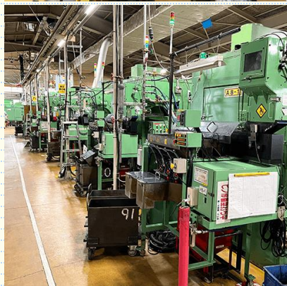
▲ 本社工場内風景。 空調が整備されています。