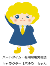
パートタイム・有期雇用労働法 キャラクター「ハゆう」ちゃん