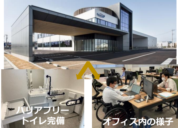
バリアフリー トイレ完備