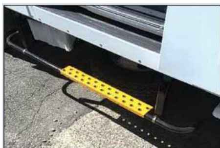
←ステップの設置例