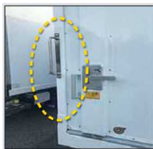
←グリップの設置例