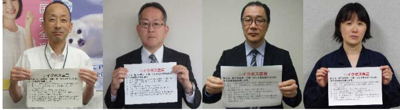
金沢労働基準監督署長