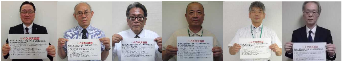
金沢公共職業安定所長

私は、仕事もプライベートも大切に、「お互いさま」の心で助け合える職場を目指します。