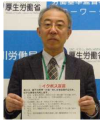
労働保険徴収室長