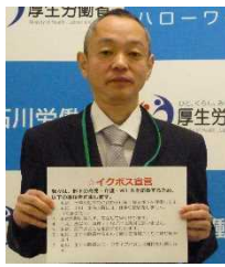
需給調整事業室長