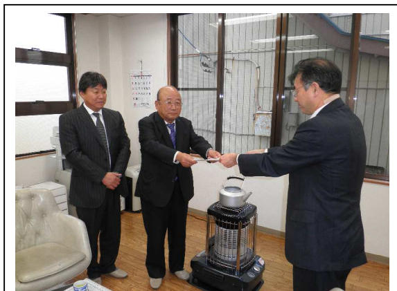
建設業労働災害防止協会筑西分会の柴分会長、小薬副分会長への要請の様子。