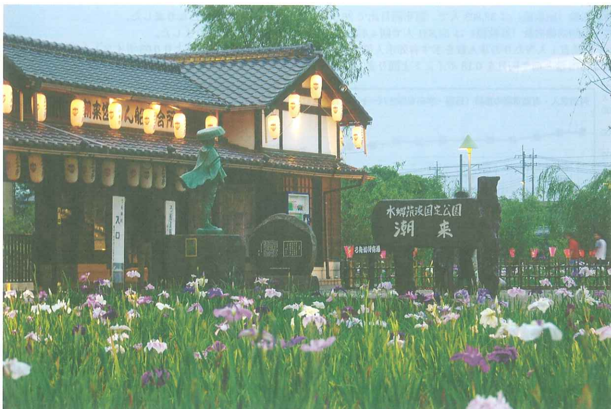
「潮来のあやめまつり（潮来市）」