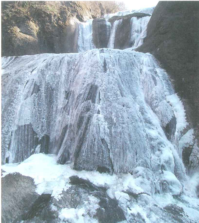
「袋田の滝（大子町）」