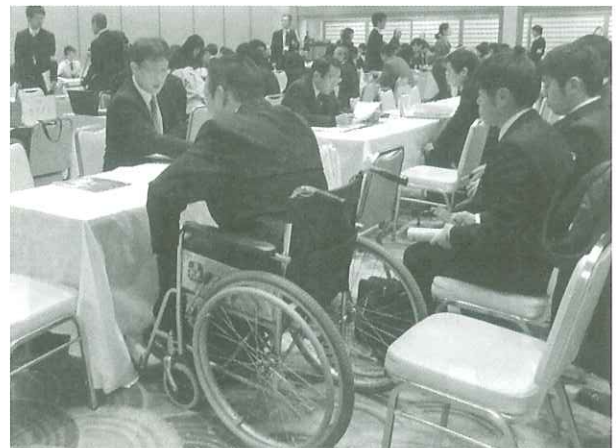
土浦会場の面接風景

今後、県内4会場（鹿行地区「鹿島セントラルホテル」：2月10日（金曜日）、県北地区「国民宿舎鶴の岬」：2月17日（金曜日）、県西地区「結城市民情報センター」：2月22日（水曜日）、県央地区「ホテルレイクビュー水戸」：2月24日（金曜日））において、障害者就職面接会が開催されます。