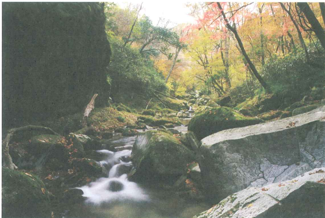
「花貫溪谷（高萩市）」