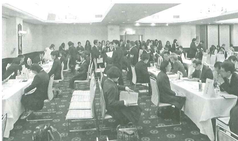
真剣に面接する高校生

各会場とも、希望の会社のブースで面接が行われ、生徒の皆さんは真剣な眼差しで、企業の担当者から説明を受けておりました。