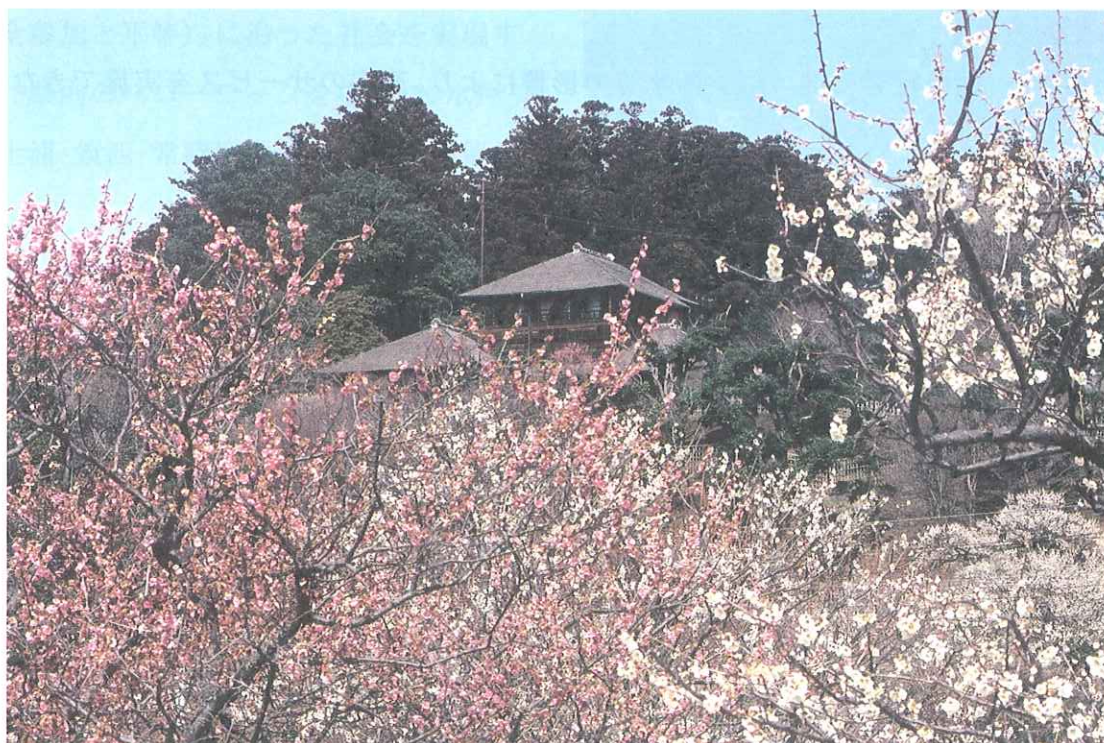
「偕楽園（水戸市）」