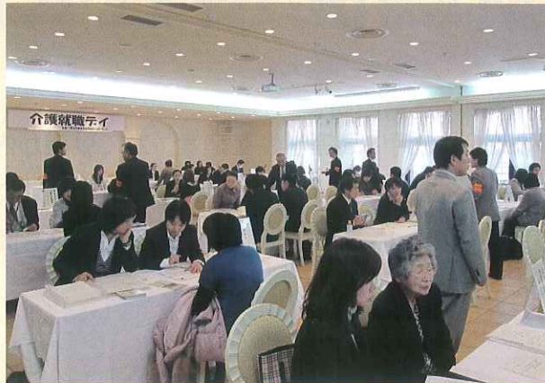
(写真) 12月17日 フェリヴェール・サンシャイン ハローワーク水戸主催の「介護就職デイ」

中でも、ハローワーク水戸(写真参照)が12月17日に開催した「介護就職デイ」には、25施設と求職者151名が参加され、初めに、参加各施設からそれぞれの施設の特徴などのPRを、その後、各ブースでは面接が行われ、参加者の真剣さが伝わる有意義な「介護就職デイ」となりました。