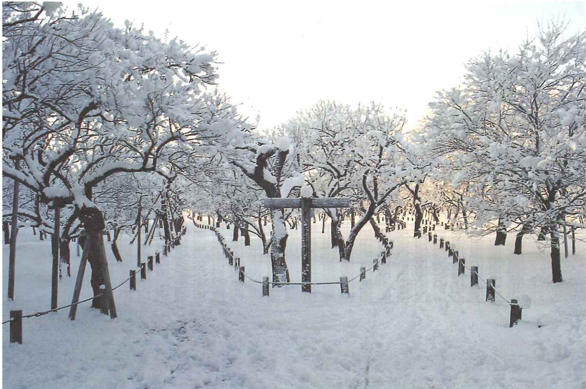
「雪の偕楽園（水戸市）」いばらきフォトダウンロード