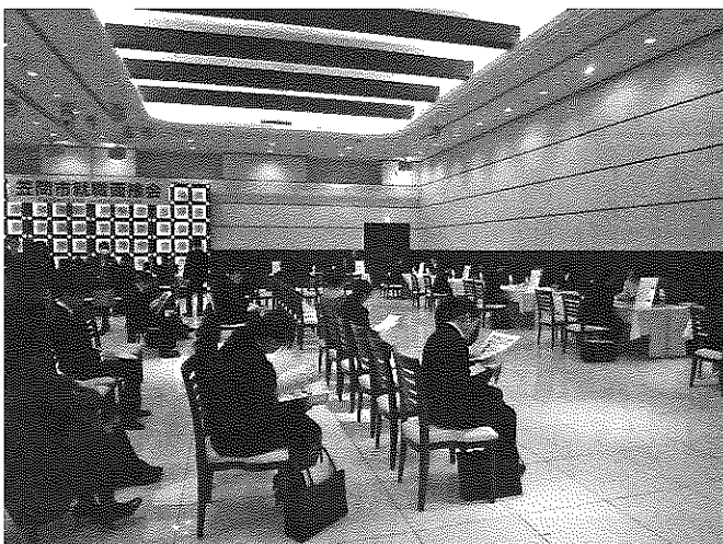
笠間市就職面接会の様子

平成26年1月22日（水）に笠間市のパークスガーデンプレイスに於いて、平成26年3月に卒業を予定する大学生等（既卒者を含む）並びに高校生を対象とした就職面接会が開催されました。この面接会は、未内定者の就職を支援するために、笠間市・ハローワーク笠間が中心となり、市内を中心とした企業15社が参加して行われました。学生参加は30の学校より51名に上り、積極的な面接が行われていました。