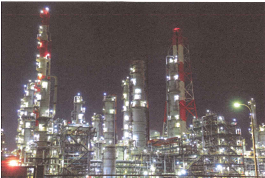
「鹿島港の夜景（神栖市）」 いばらきフォトダウンロード