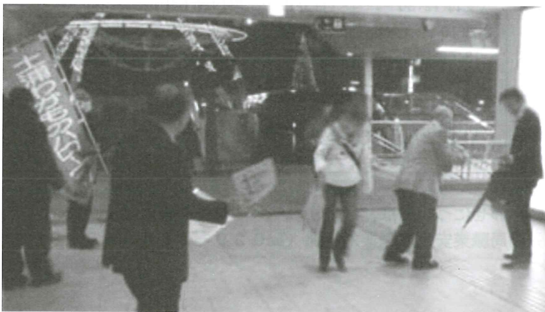
ハローワークの案内リーフレット等を配布する職員

ハローワーク土浦では、今後もハローワークが行っている支援について積極的に PR を行う予定です。